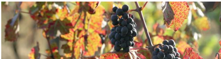
Des cultures de plantes en biodynamie - Biodynamic plant cultures