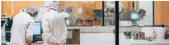
Un savoir-faire industriel reconnu - A recognized industrial expertise