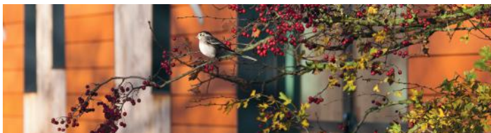
Une industrie en pleine Nature - A cosmetic industry surrounded by Nature

Accompagné d'un guide, salarié de l'entreprise, plongez dans les coulisses de fabrication des produits Body Nature au cœur d'un Domaine où la biodiversité est préservée.