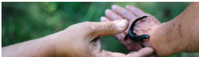
Atelier Biodiversité du Bocage - Workshop Countryside's Biodiversity

Dans un esprit de partage et de convivialité, nos ateliers mettent l'accent sur certaines thématiques comme la découverte de nos matières premières, l'amélioration de votre bien-être ou la préservation de la biodiversité.