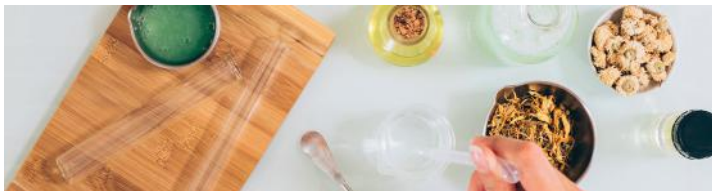
Des produits sains pour l'Homme et l'environnement - Safe products for Humans and Nature