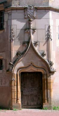
Porte de la tourelle de l'Hôtel Tyndo

Au XIII e siècle, la cité des Vicomtes de Thouars est protégée par une muraille composée de 40 tours de défense (4). Une tour porte est aménagée pour le passage de la garnison. Elle