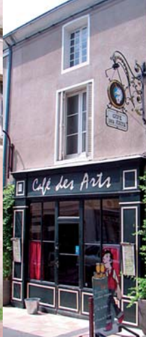
Façade du café des arts

Cette tour était l'entrée principale de la ville au nord et, en cas de conflit, sa meilleure défense. Le passage sous la tour présente tous les dispositifs essentiels en cas d'attaque (emplacement de deux herse et de trois assommoirs). Descendez la rue Porte au Prévost et arrêtez-vous au n°39. A l'emplacement de ces maisons, le long de la rue, une église fut