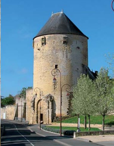
Tour Prince de Galles

Située au cœur de la cité médiévale, l'église Saint-Médard (1) est construite au XII e siècle. La façade nord est décorée par un portail polylobé d'architecture mozarabe. Sa façade ouest présente plusieurs scènes du Nouveau Testament. Remanié aux XV e et XVI e siècles cet édifice fait l'objet, depuis les années 1990, d'importants travaux de restauration. A l'intérieur, un dépliant gratuit de visite de l'édifice vous est proposé. Dès le XII e siècle, la place est occupée par un cimetière. Celui-ci cède sa place progressivement aux foires et marchés, festivités et exécutions publiques. Le cimetière est déplacé hors les murs dès le XVIII e siècle. Traversez la place et empruntez la rue Saugé. Aidez-vous du plan.