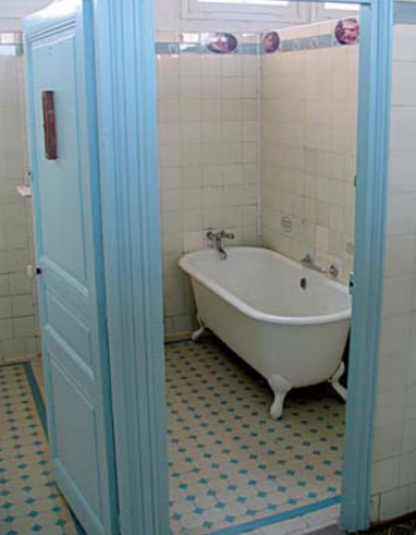
Cabine des anciens Bains-Douches

En haut de la rue, avancez sur le parvis de la chapelle Jeanne d'Arc (9). Dernier témoin de la présence d'une école privée construite au XIX e siècle, la chapelle est devenue un Centre d'Art. Plusieurs expositions y sont présentées toute l'année. Redescendez le parvis et remontez sur la droite toute la rue Porte de Paris. Au croisement de la rue Balzac, arrêtez-vous un instant (10). Avant 1840, une tour porte protégeait cette rue. D'où vous