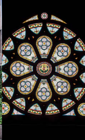
Rosace de la chapelle Jeanne d'Arc

construite au XV e siècle pour le couvent des Jacobins (7). Seule une chapelle et quelques murs subsistent encore (vous l'apercevez au fond de la cour). Poursuivez et, en bas de la rue, prenez à droite la rue Saint-Médard.