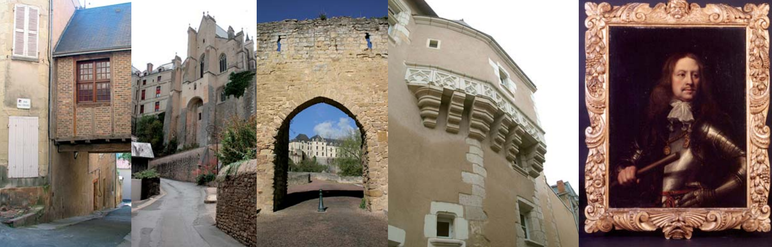
Ballet dans la rue des Cosses