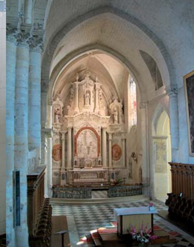
Chœur de l'église abbatiale Saint-Laon

Descendez la rue Drouyneau de Brie. A l'angle avec la rue Har-cher, admirez un porche du XVII e siècle (13). Entrez dans le jardin de l'hôtel de ville (14). La mairie est installée depuis 1850 dans l'ancienne abbaye Saint-Laon.