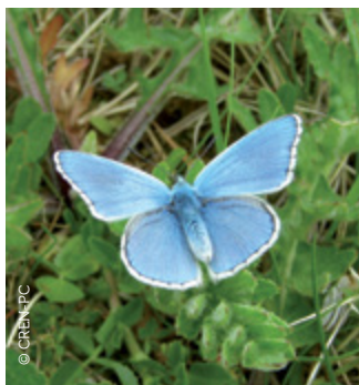
Argus bleu céleste