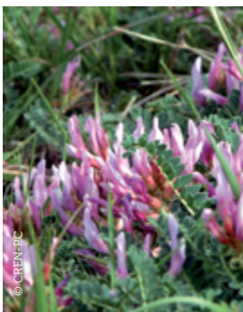
Astragale de Montpellier

Les vallées sèches d'Availles-Thouarsais présentent des coteaux à fortes pentes exposés au sud. Ces conditions particulières et la nature calcaire du sol ont permis le développement d'un habitat patrimonial, la pelouse sèche calcicole. Cet habitat aujourd'hui rare et menacé abrite un grand nombre d'espèces singulières à tendance méridionale. Ainsi, vous pourrez découvrir une flore méconnue comme l'Hélianthème des Appennins ou l'Astragale de Montpellier et une faune chatoyante tel l'Argus bleu céleste.