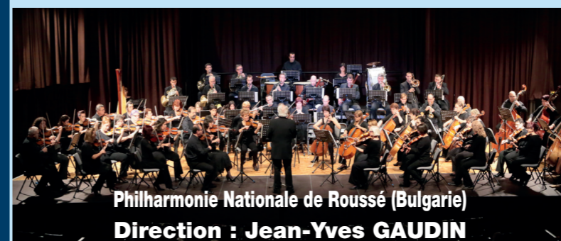
Philharmonie Nationale de Roussé (Bulgarie)