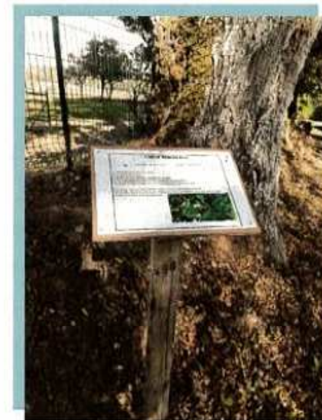
Code du balisage